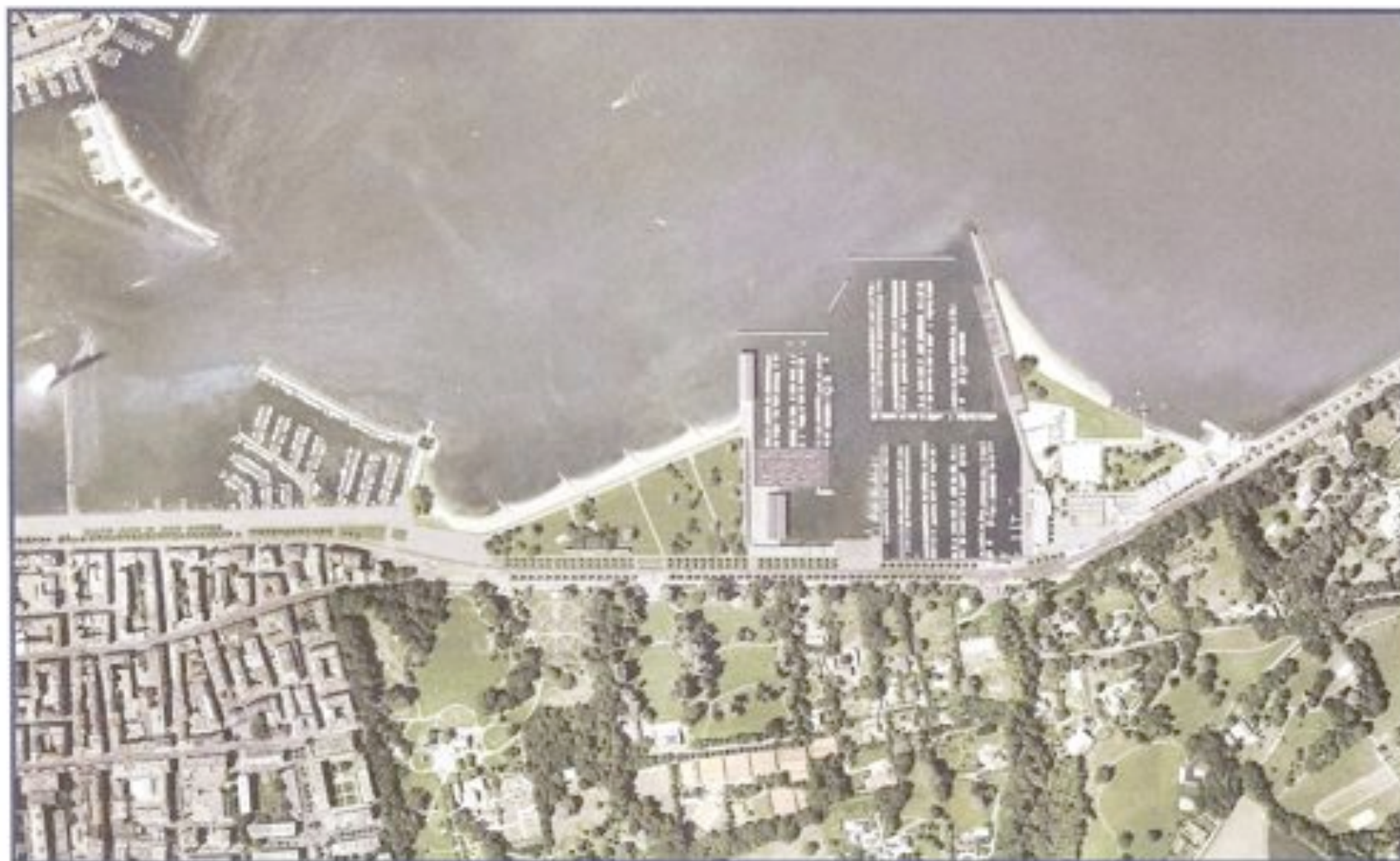
Photomontage du projet d'aménagement du Doy de la Nautique, d'aménagement du Doy public et de réalisation du Doy dans les Eaux-Vives